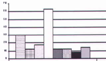
شکل ۲: توزیع موضوعی مقالات و طرحهای مربوط به شبکه‌ی واژگانی [۱۲]

دسترسی آسان و کیفیت و توانایی بالقوه‌ی شبکه‌ی واژگانی در زمینه‌ی پردازش زبان طبیعی عامل گسترش و موفقیت روز افزون آن بوده است. شکل ۲ توزیع موضوعی مقالات و طرحهای تحقیقاتی را طی سالهای ۱۹۹۴ تا ۲۰۰۳ نشان می‌دهد [۱۲]. در این نمودار بازیابی تصویر با کمتر از ۸ مورد و ابهام زدایی مفهومی با بیش از ۶۸ مورد رکورد داران استفاده از شبکه‌ی واژگانی بوده‌اند.