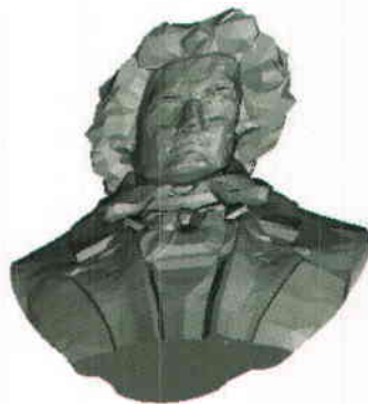
مدل نخست پس از حمله جدید